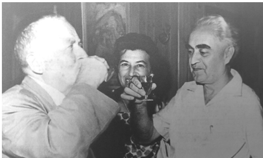
ישראל וצביה כהן עם ש"י עגנון, 1963

המחבר מתאר את שלוש הדרכים שבהן "נערכה פגישת הפתגמים": (א) הקבלת הפתגם העברי המקראי והתלמודי וכן המאוחר יותר לפתגם הלועזי; (ב) העלאת פתגמים עבריים חדשים, שאינם ידועים או שלא היו במחזור השימוש; (ג) דרך התרגום. המחבר מודה שהפתגמים, "שאינן בצדם ציון מקורם, או שם יוצרם, מקצתם משל המחבר ומקצתם נעוץ במקורות, שנתעלמו מידיעתו". "מקצת" זה, של תרגום ומתן לבוש עברי, שהוא הרבה מאוד, עומד במרכזו של מאמר זה.