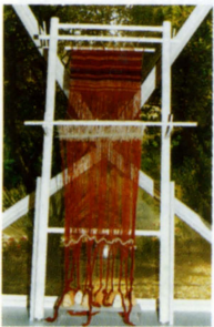
שחזור נוֹל מהתערוכה "סיפוריה של מצדה", האוניברסיטה העברית

הַרְוּחַ שֶׁנִּפְעַר בֵּין שְׁתֵּי מַעְרְכוֹת הַשְּׁתֵּי בַעַת הָאֲרִיגָה בְּנוֹל, וְבוּ מַעֲבִירִים אֶת חוֹט הָעֶרֶב. נֶפֶשׁ הַמִּסְכָּת מִן הַמִּשְׁנָה, כְּגוֹן כְּלִים כֵּא, א. הַמִּילָה נֶפֶשׁ מִתְפַּרֶשֶׁת בְּצִירוֹף הַזֶּה בְּמִשְׁמַע רְוּחַ.