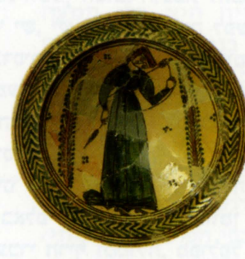
מלאכת הטווייה בכישור ובפלך, עכו המאה ה-13; באדיבות רשות העתיקות, תצלום – צילה שגיב