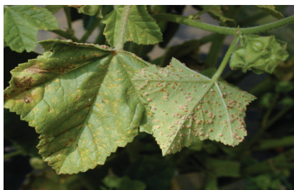
חילדון בעלה חלמית (חוביזה)