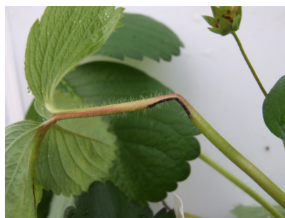
גחלון בתות שדה - צלקת בפטוטרת של עלה

פעלים ומילים מן השורש כמ"ש מוכרים מלשון חכמים. כדי לשמור על רעננות הערבות בשבת של חג הסוכות נאמר שהיו "מניחין אותן בגיגיות של זהב כדי שלא יכמושו" (משנה סוכה ד, ו). כמישה היא נבילה, קמילה.