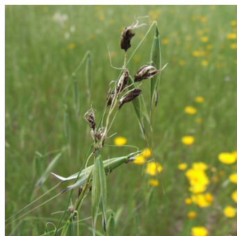
פחמון פורח בשיבולת שועל

מסימני המחלה: פצע כהה בפרי המלווה לעתים בהילה אדומה והנראה כפחם או כגחלת. בנגיעות חמורה הפרות מצטמקים והמחלה עשויה אף להמית את הצמח כולו.