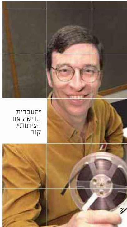
"העברית הביאה את קור הציונות"

שואלים אותי: הביא או הביא? הכיר או הכיר? מכיר, מכיר, מביא, מביא? שדרן שלנו אמר לפני כמה ימים: 'מביס אותם'. אם היו הוגים נכון את הדגש החזק, היו פחות טעויות". קור: "חלק מהבעיה הוא הזמר העברי. עברתי ליד בית ספר בהרצליה, ובהפסקה הרמקולים משררים שיר באנגלית. איך המנהלת עדיין ממשיכה לעבוד שם? גלי צה"ל הוא המקום היחיד בארץ שמכשי"רים כל הזמן את האנשים שבאים לע"שנה בערך, הגרתי שבע שעות הכשרה לכתבים החדשים. עכשיו הקורס אורך 60 שעות הכשרה".