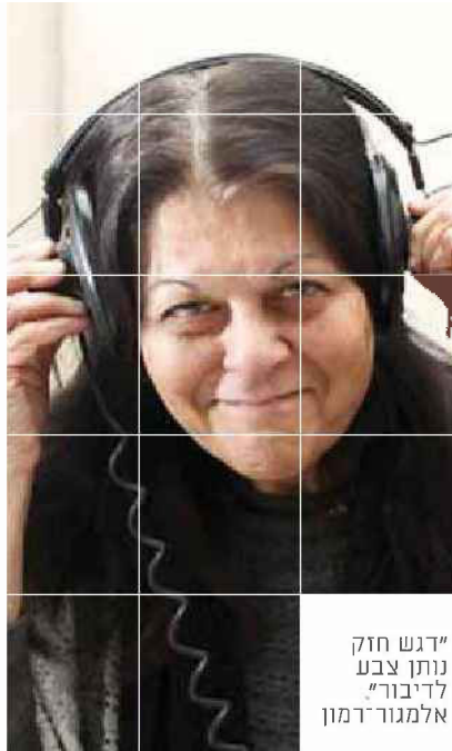
"דגש חזק נותן צבע לדיבור" אלמגור-רמון

רית? בעניין הזה הרצל הענק טעה. היום קונים כרטיס ברכבת בעברית."