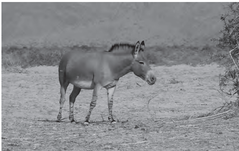
ערוד (חמור בר)

מסתבר שבתקופה הקדומה נצרכו לבני מכלוא אלה כבהמות עבודה בשל תכונותיהם המיוחדות וגם בהיותם חיות אקזוטיות. הדבר עולה מכמה תעודות שבארכיון הפקיד התלמי זנון, שביקר בארץ ישראל באמצע המאה השלישית לפסה"נ. בתעודת מסחר