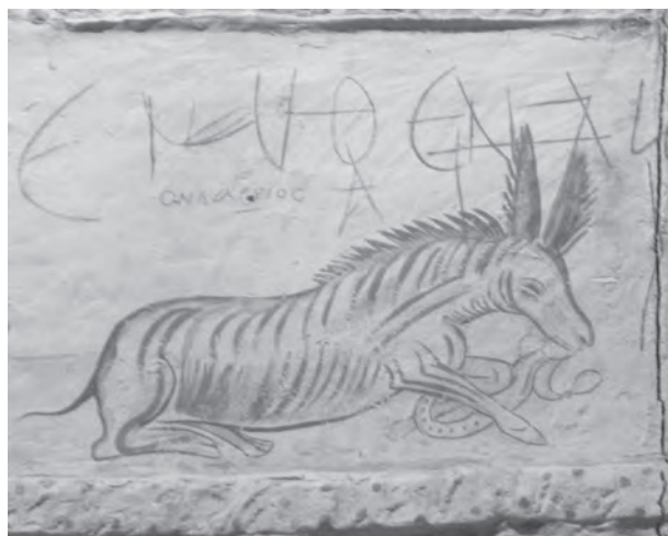
איור של חמור בר אפריקני, מרישה

האפשרויות להבדיל ביניהם במקורות היא בדיקת ההקשר הגאוגרפי שבו הם נזכרים: בין תתי-המין של הפרא האסייתיים 32 ובין חמורי הבר האפריקניים. גם דמויות בעלי החיים הנמצאות באיורים, למשל בתבליטי נינווה או בפסיפס של בית הכנסת בגרש, היו מקור לפרשנויות אחדות, ולרוב אינן מאפשרות זיהוי חד-משמעי. 33 פעמים שהאמנים הקדומים הושפעו ממקורות שאינם קשורים כלל למרחב שבו נמצא הציור. לשם דוגמה, איור של חמור הבר הנאבק בנחש מהמערה הצידונית במרישה (המאה השלישית לפסה"נ), שמעליו רשום ביוונית ONAPIOC. 34 האוזניים הגדולות והשעירות של בעל החיים והרעמה הזקופה מראים שמדובר בחמור בר אפריקני ולא בפרא, 35 ולמעשה כבר הוכח שכל הסצנות של שאר בעלי החיים המופיעים במרישה הם בהשפעה מצרית. 36 כך הדבר גם בכלי מחקר אחרים: המחקר