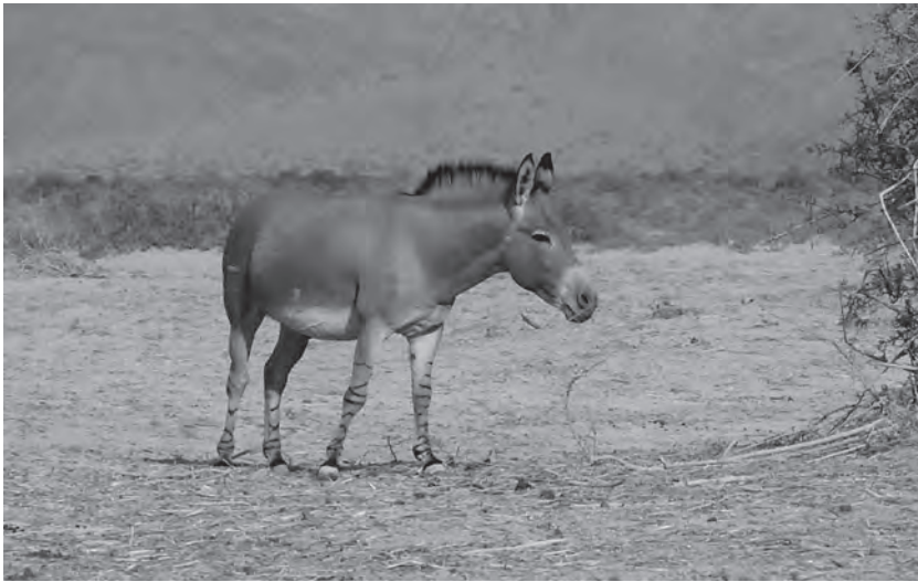
ערוד (חמור בר; צילום: עוזי פז)

מסתבר שבתקופה הקדומה נצרכו לבני מכלוא אלה כבהמות עבודה בשל תכונותיהם המיוחדות וגם בהיותם חיות אקזוטיות. הדבר עולה מכמה תעודות שבארכיון הפקיד התלמי זנון, שביקר בארץ ישראל באמצע המאה השלישית לפסה"נ. בתעודת מסחר