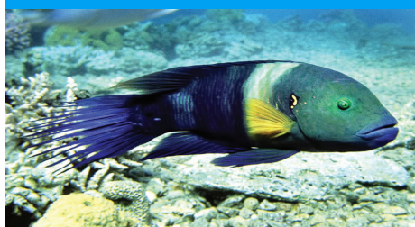
השם המדעי: Cheilinus lunulatus